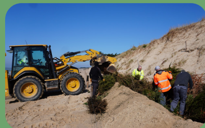
Pose des sapins 2025

La municipalité de L'Épine poursuit son engagement en faveur de la défense douce de son littoral face à l'érosion. Comme chaque année, une nouvelle action a été menée le lundi 3 mars dernier sur la plage de l'Océan. Les sapins de Noël collectés après les fêtes sont implantés au pied des dunes, au plus près de l'à-pic, afin de freiner le transport éolien du sable et ainsi favoriser la stabilisation naturelle du littoral. Portée par les services techniques de la commune, cette démarche, à la fois simple et efficace, permet de lutter contre l'érosion côtière tout en recyclant les sapins collectés. Ce dispositif maintenant mis en place depuis plusieurs années montre son efficacité dans la simplicité.