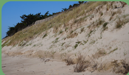
Dune confortée par les sapins 2024