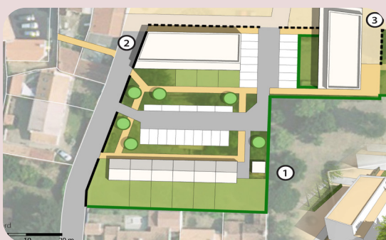
vue non contractuelle des 20 logements intergénérationnels

Un dossier d'agrément « Aide à la Vie Partagée » a été déposé pour garantir la réussite de ce projet attendu par tous.