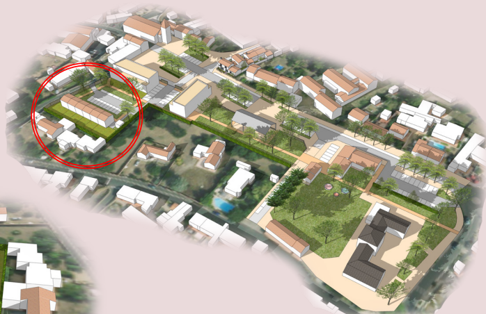
vue non contractuelle de l'ensemble du centre-bourg